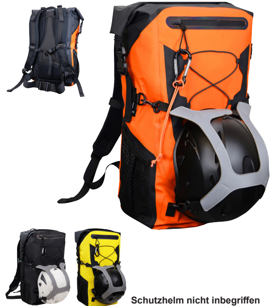
Schutzhelm nicht inbegriffen

Der 35-Liter-Rucksack, der alle Anforderungen erfüllt: Funktionell, wasserdicht, langlebig, mit hochwertigen Details.